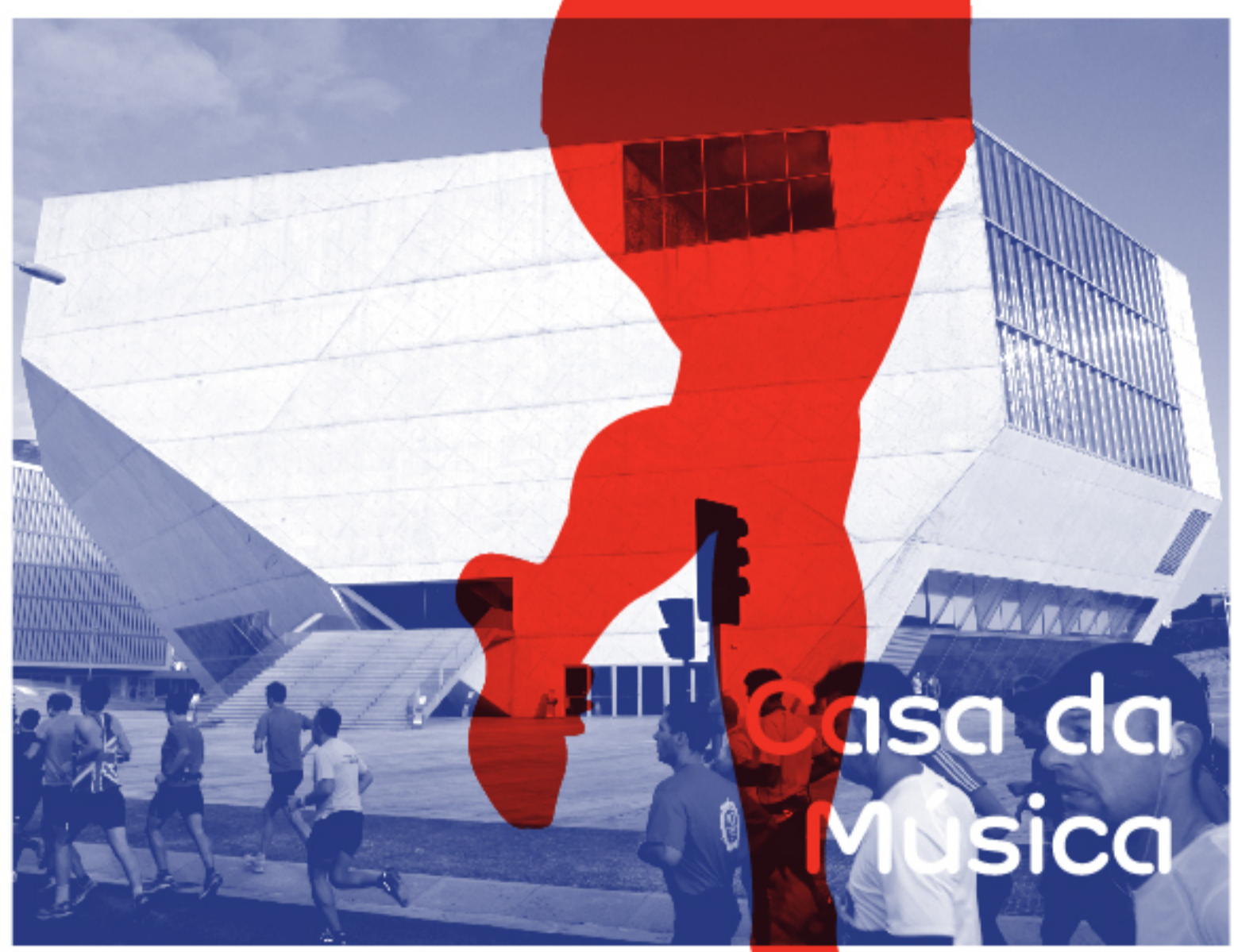
Casa da Música