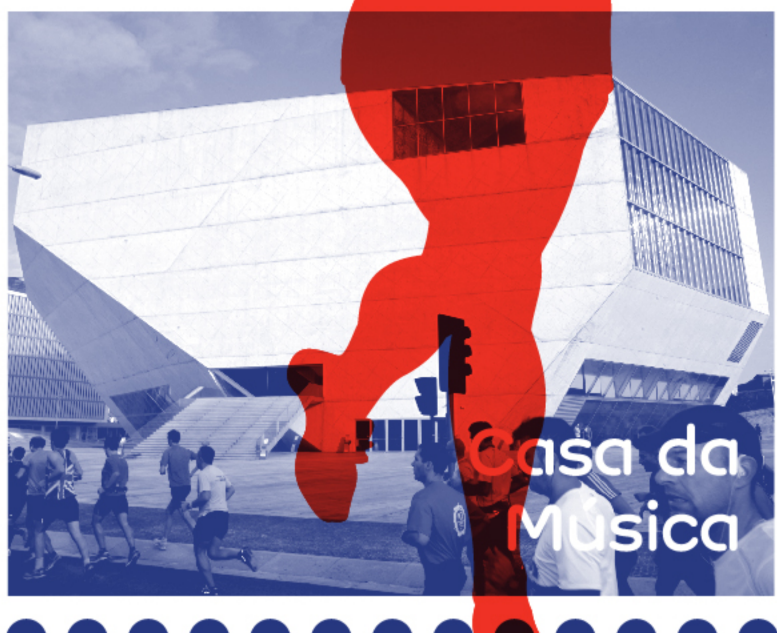
Casa da Música