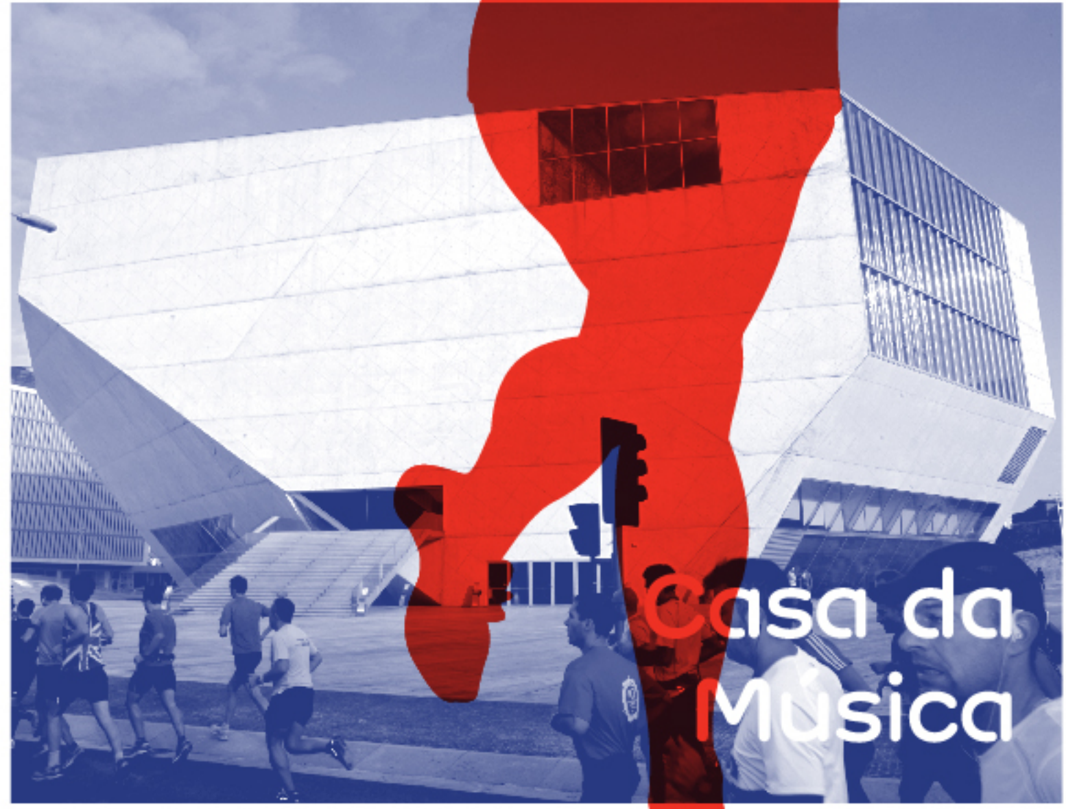
Casa da Música