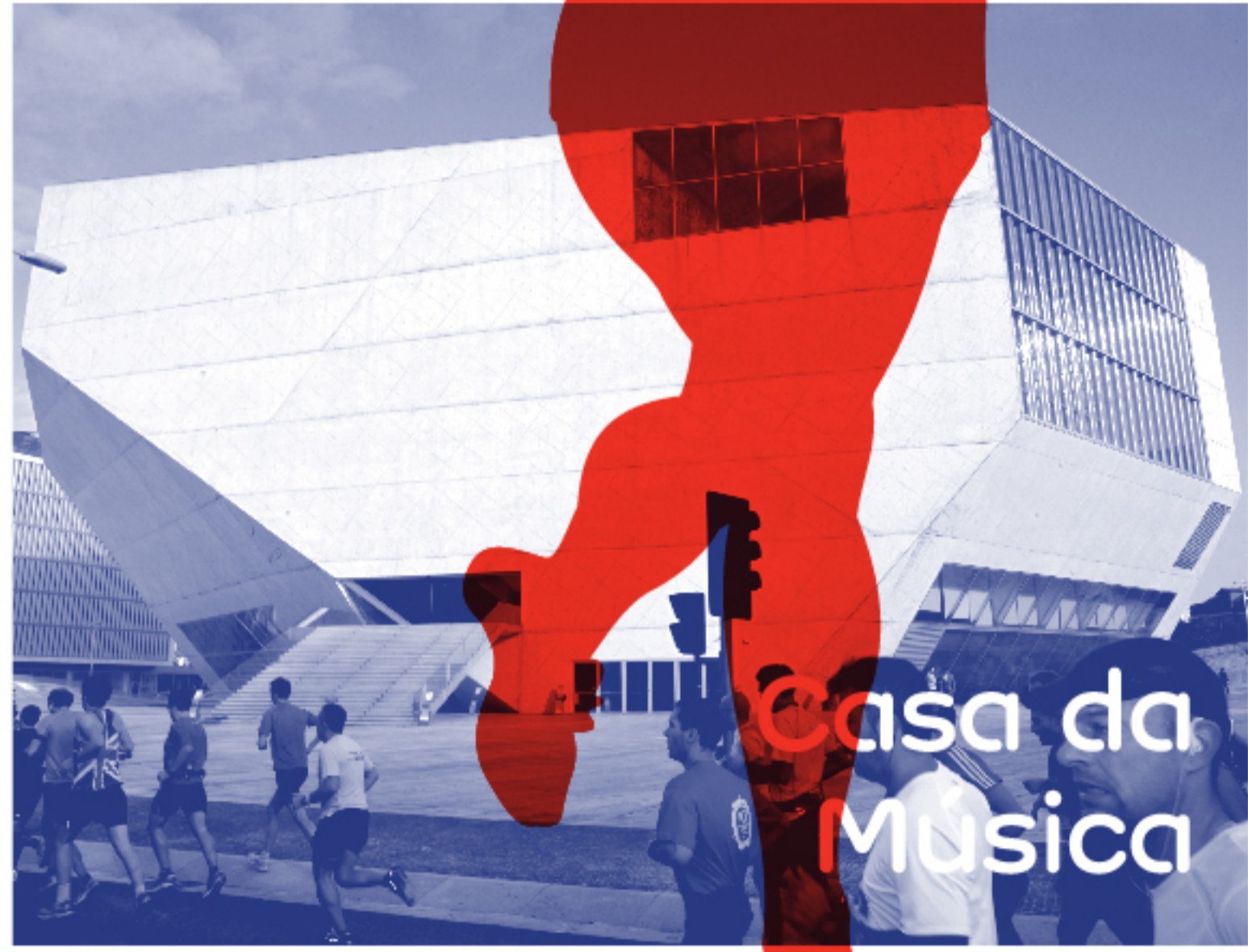
Casa da Música