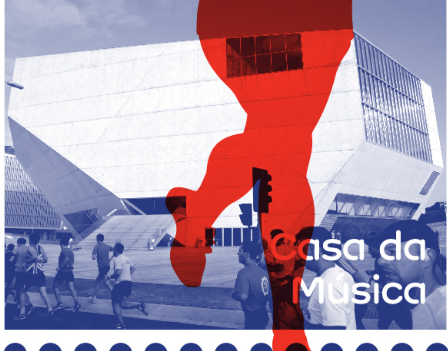
Casa da Música