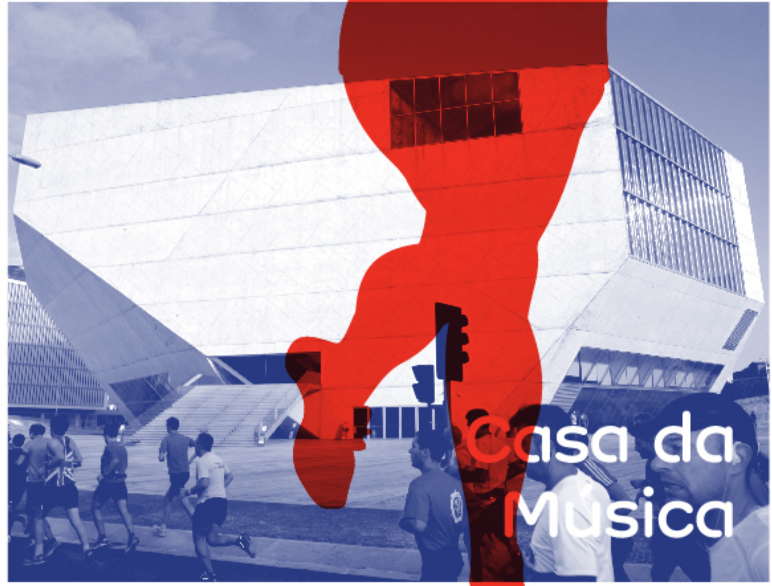
Casa da Música