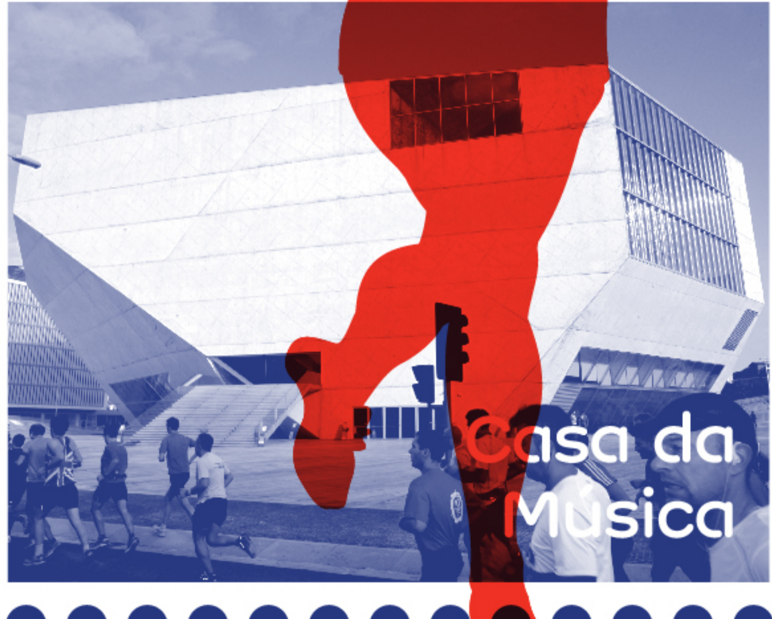
Casa da Música