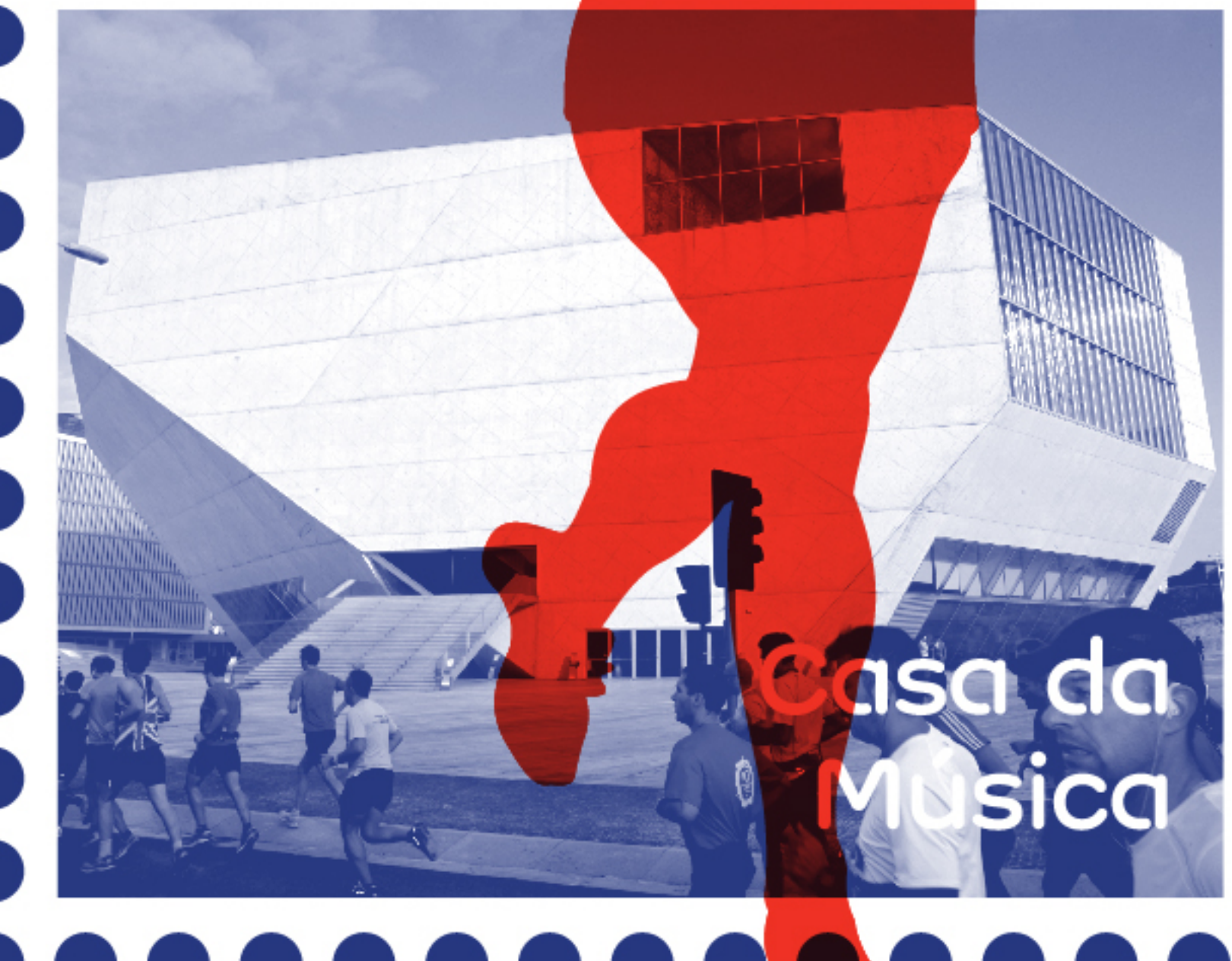
Casa da Música