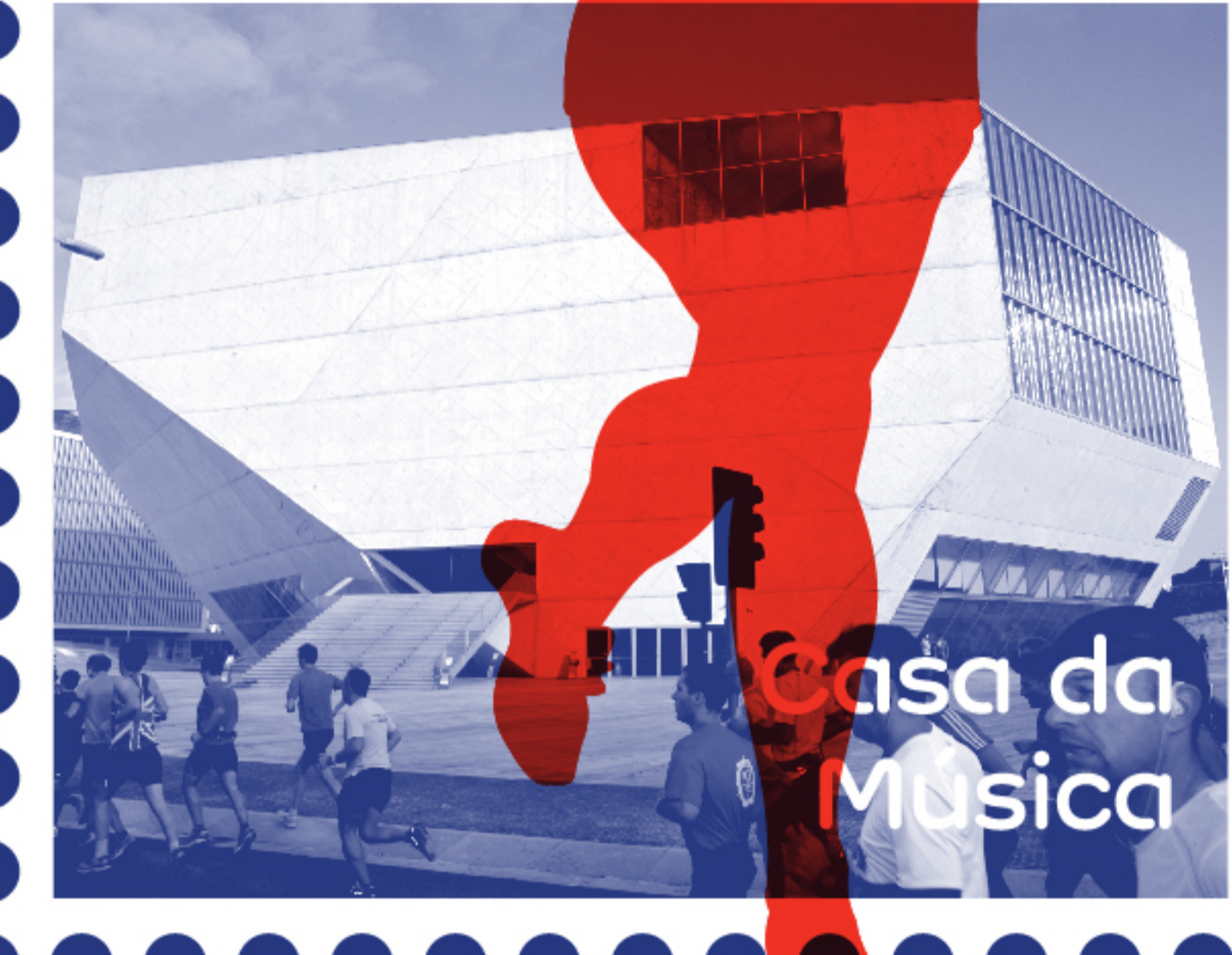
Casa da Música