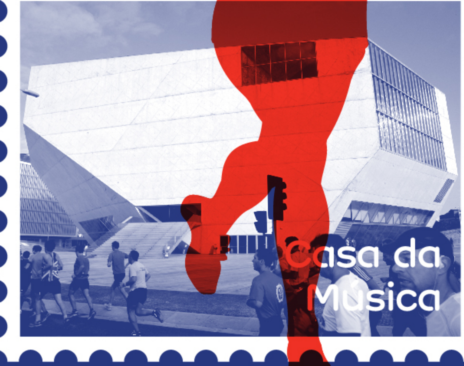
Casa da Música