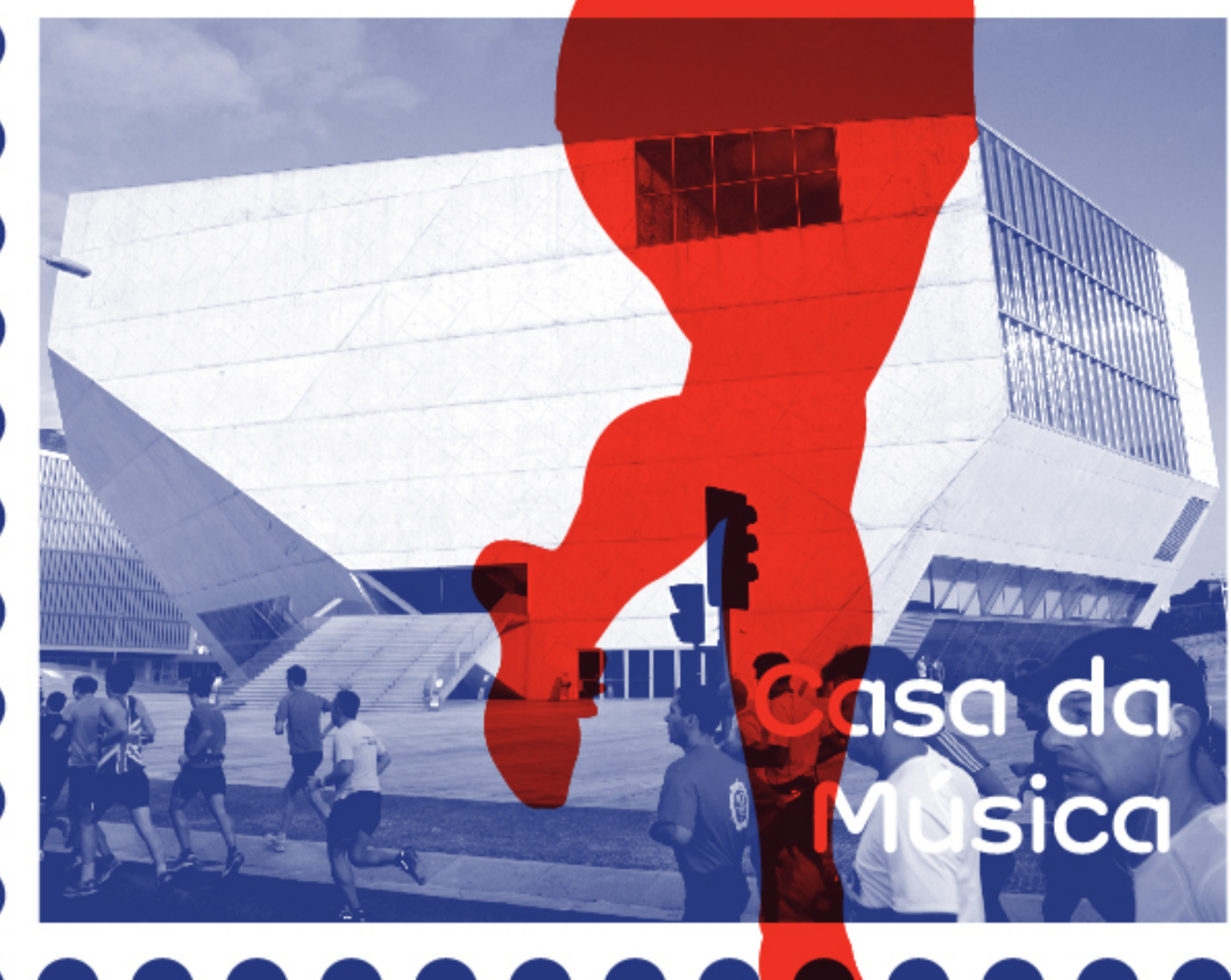
Casa da Música