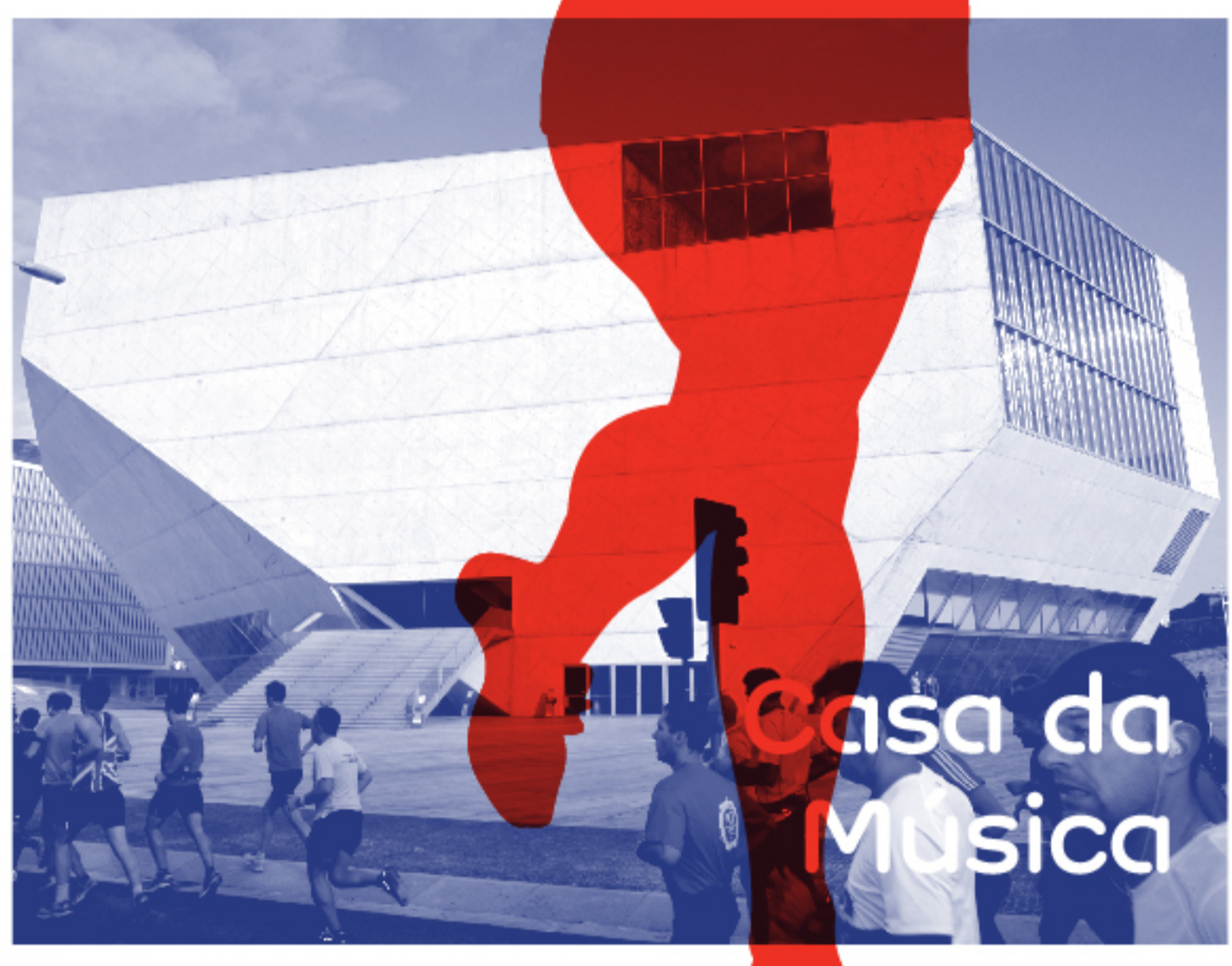
Casa da Música