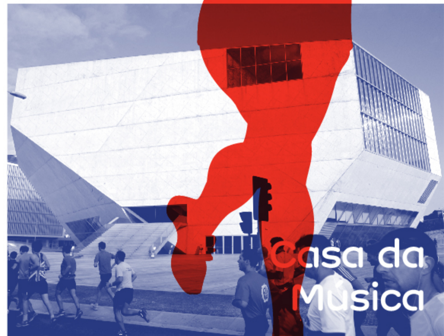
Casa da Música